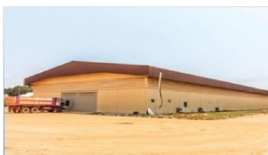
4. อาคารคลังสินค้า (R12)