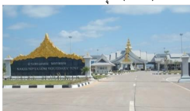
5. อาคารด่านชายแดน (CIQ)