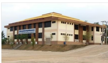
2. อาคารศูนย์บริการเบ็ดเสร็จ ด้านการลงทุน (OSS)