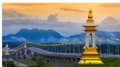
1. สะพานมิตรภาพ 3 (นครพนม-คำม่วน)