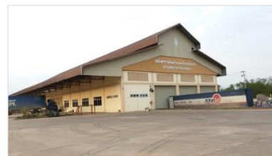
3. อาคารคลังตรวจสินค้าและเก็บของกลาง (R8)