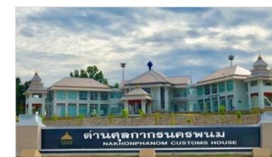
6. ด่านศุลกากรนครพนมแห่งใหม่