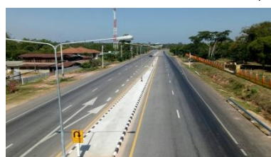
7. เส้นทางหลวงเพื่อนสนับสนุนเขตเศรษฐกิจพิเศษ (ทางหลวงหมายเลข 212)